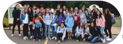
Grupo Harlow 1