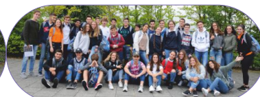
Grupo Welwyn Garden City