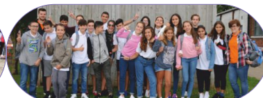
Grupo Harlow 2